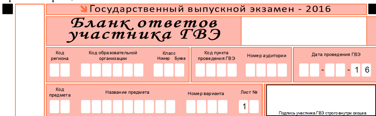
Рис. 1. Верхняя часть бланка регистрации

В верхней части бланка ответов (рис. 1) расположены: вертикальный и горизонтальный штрих-коды, поля для рукописного занесения информации, строка с образцами написания символов.