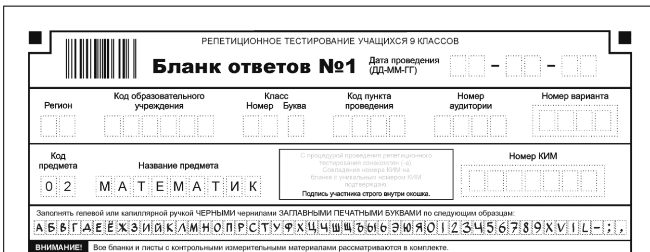
Рис. 1. Верхняя часть бланка ответов № 1

В верхней части бланка ответов № 1 (рис. 1) расположены горизонтальный штрихкод, поля для заполнения участником ГИА, поле для подписи участника ГИА, строка с образцами написания символов.